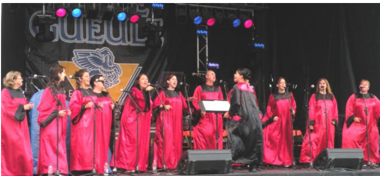
Photo : La chorale gospel Mystika. Spectacle présenté par la SDC Centre-ville

Le stationnement De Bigarré vibrait au son de la musique Blues du 19 au 22 août dernier alors que se déroulait la 13 e édition du Festival de Blues Victoriaville. Une fin de semaine qui a su ravir les amateurs de musique de même que le nouveau comité organisateur qui en dresse un bilan positif. De plus, durant tout le festival, des restaurateurs ont offert des soupers-blues alors que quelques bars présentaient en fin de soirée des spectacles plus intimes. Notons que l'équipe reviendra l'an prochain pour nous offrir une quatorzième édition.